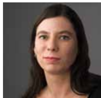
Sandra Scheeres Senatorin für Bildung, Jugend und Wissenschaft des Landes Berlin