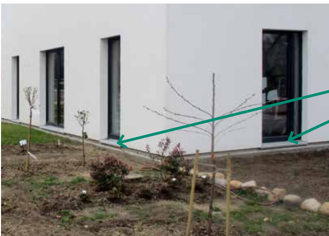
Sohlbänke an einem Neubau.